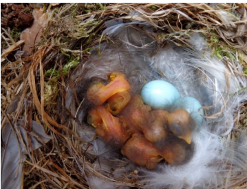
Jonge zwarte roodstaarten in klomp

Naast de zwarte roodstaart is er ook nog een gekraagde roodstaart. Die komt vaker voor en het mannetje daarvan is duidelijk herkenbaar aan een oranje bost en buik en de bovenschedel daarvan is lichtgrijs.