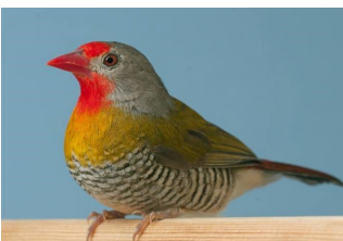
Melba astrilde ( Pytilia melba melba )