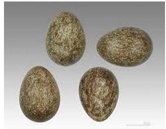
Eitjes van een ringmus