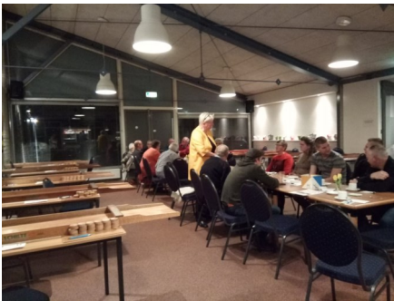
Sjoelbakken klaar? Sjoelen maar!