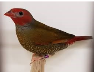
Wiener astrilde ( Pytilia afra )