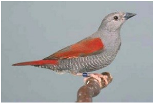
Aurora astrilde ( Pytilia phoenicoptera )