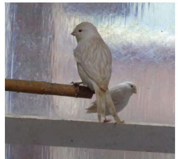
< rood intensief