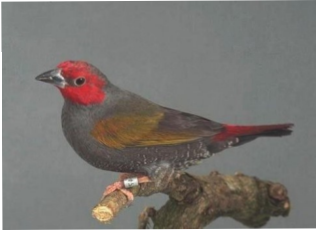
Roodmasker aurora ( Pytilia hypogrammica )